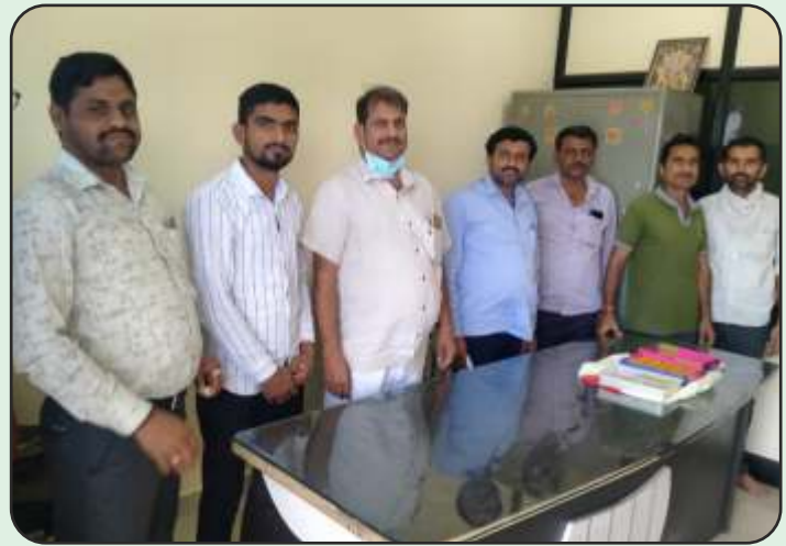
Opening of New Office Premises, MLL Gandhidham