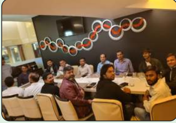
Party for Highest Production in December 2020 in Ambethi Factory, Vapi