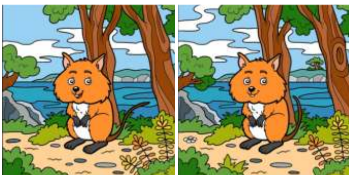
Spot 10 Differences in both pictures