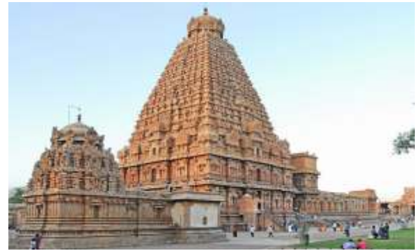
Collected by Muskan Maheshwari, Vapi

It also mentions the different kinds of jewels used in the period. A total of twenty three different types of pearls, eleven varieties of diamonds and rubies are mentioned in these inscriptions. This architectural masterpiece has been designated as UNESCO World Heritage Site.