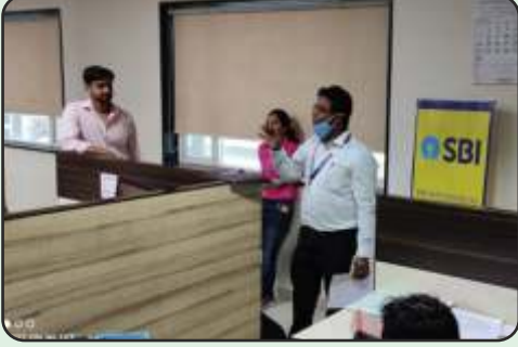
SBI visit to open Salary Account at MLL House, Vapi