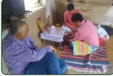
Mantra jaap at Ambethi Factory, Vapi