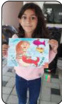
Key Holders & Painting made by Vidhi Maheshwari, Vapi