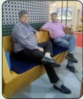
Visit to Yarn Expo at Surat