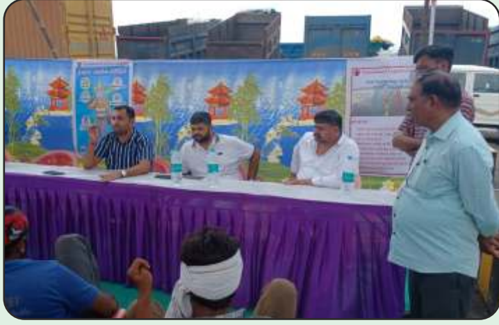
Driver's Training at Dahej, Bharuch