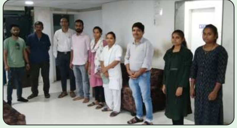
Vaccination Camp at Ambethi Factory, Vapi 105 Employees Vaccinated