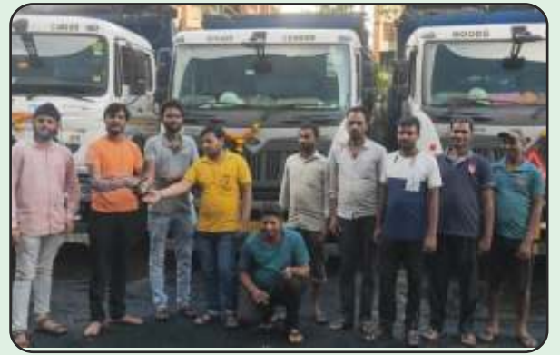
Vishwakarma Pooja at MLL House, Vapi