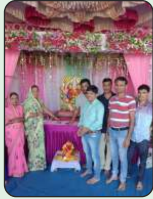
Ganpati Celebration at Ambethi Factory, Vapi