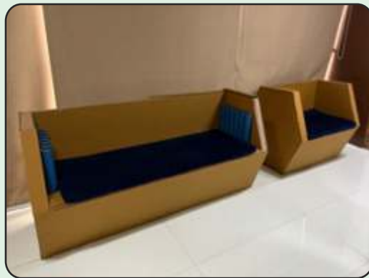
Alternate use of Paper